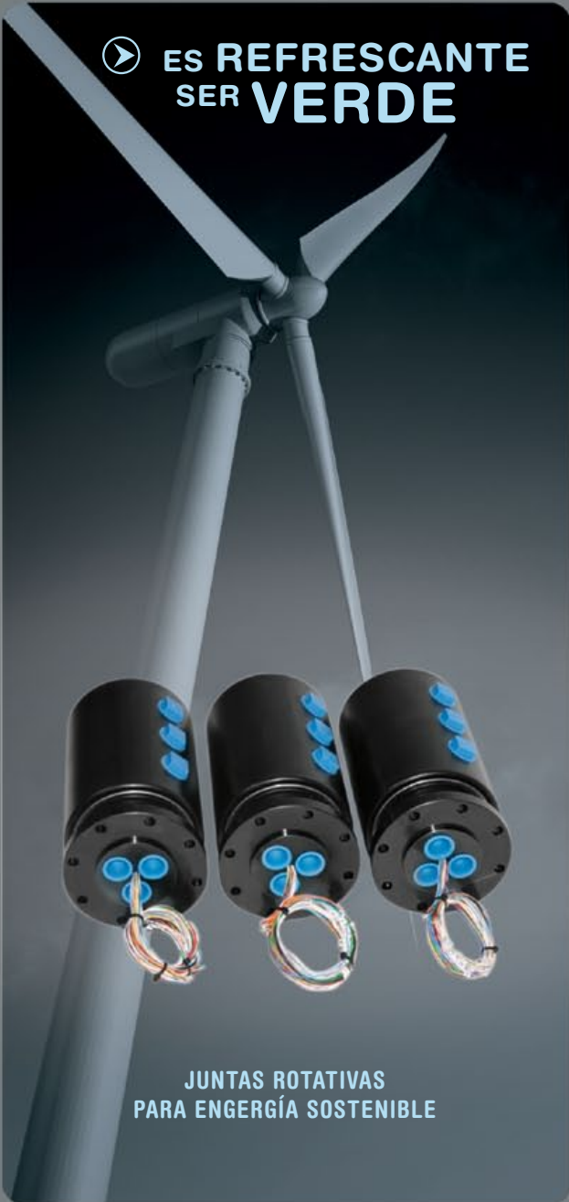
JUNTAS ROTATIVAS PARA ENERGIÁ SOSTENIBLE